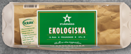
12-PACK EKOLOGISKA ÄGG