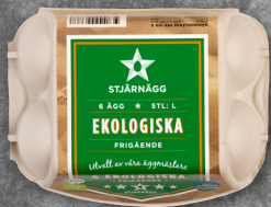
6-PACK EKOLOGISKA ÄGG