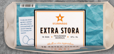
10-PACK EXTRA STORA ÄGG