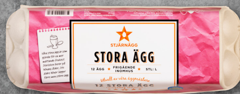
12-PACK STORA ÄGG