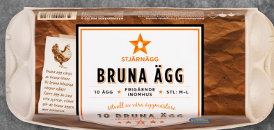
10-PACK BRUNA ÄGG